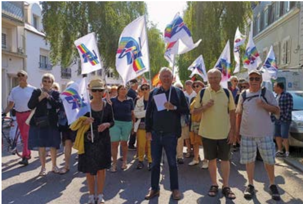
En France, il y a 17 millions de retraités, et parmi eux, près de 3 millions sont bénévoles dans des associations. Engagés, et militants pour la défense de leurs droits et de ceux des futurs retraités !

Ici, chaque action a une intention, en lien avec les valeurs, et traite une des dimensions du bien vieillir. « On conserve le lien aussi avec ceux qui ne peuvent plus sortir : on passe les voir, on crée des groupes WhatsApp, on envoie nos newsletters, on propose de faire les courses, même hors confinement. » La doyenne de l'association, qui a 99 ans, est l'une des meilleures au scrabble. Jusqu'à ses 97 ans, elle participait à la Lorientaise, une marche des femmes contre le cancer du sein.