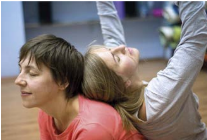
La danse-thérapie utilise le mouvement et le toucher pour se libérer de certains blocages psychologiques. Elle permet de se reconnecter à ses émotions en lâchant prise sur son corps.

L'art-thérapie est une démarche de changement que l'art thérapeute accompagne, non pas dans une démarche d'analyse, de démonstration ou d'explication rationnelle, mais dans une démarche de facilitation. Pour que le geste créatif libère, dévoile certains aspects de soi, génère des comportements nouveaux qui contribueront à des guérisons psychiques et physiques.